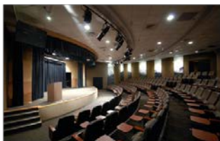
集思台大會議中心蘇格拉底廳 (台北市羅斯福路4段85號B1)