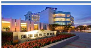
蓮潭會館402會議室 (高雄市左營區崇德路801號)