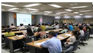
中科工商服務大樓401室 (台中市西屯區中科路2號)