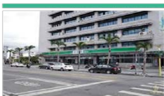
花蓮國安郵局6樓會議室 (花蓮縣花蓮市中山路408號)