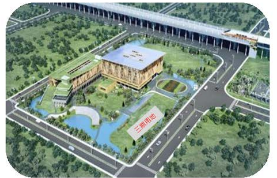
聯合研究中心一、二期鳥瞰示意圖