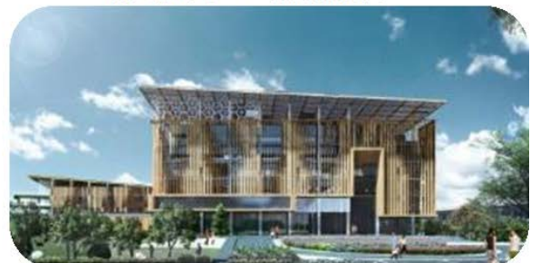
聯合研究中心正門模擬圖